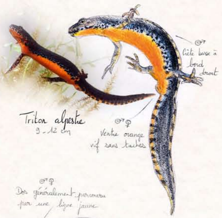
Triton alpestre 9-12 cm