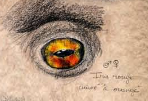
Crapaud commun 9-11 cm ♂♀ Glandes parotides proéminentes