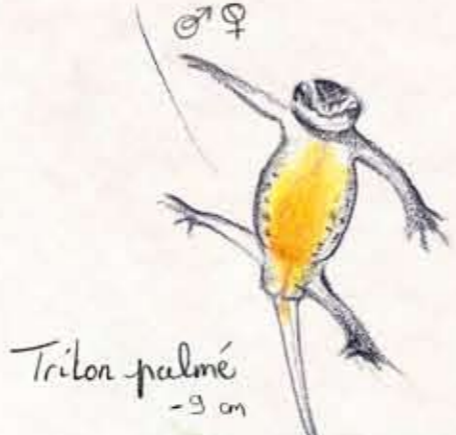
Triton palmé - 9 cm