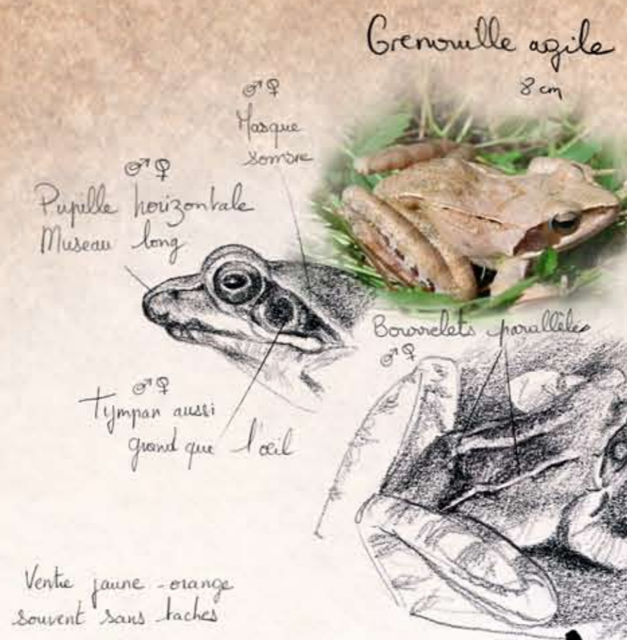
Grenouille agile 8 cm

♂♀ Face inférieure jaune vif ou orangée marbrée de gris-noir bleuté