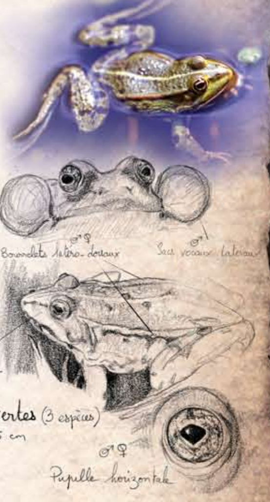
Grenouilles vertes (3 espèces) 8-15 cm