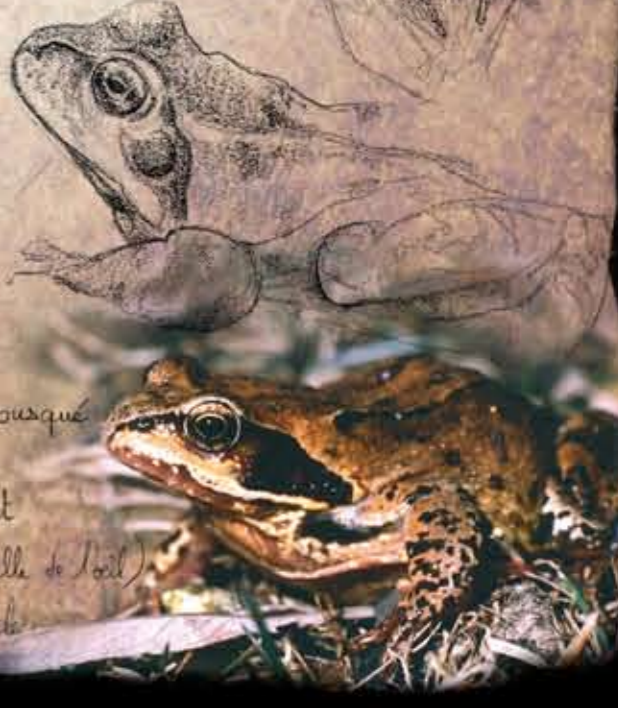
Grenouille 9 cm rousse

♂♀ Muséum arrondi et busqué Masque sombre Tympan plus petit que l'œil (1/2 taille de l'œil) Pupille horizontale