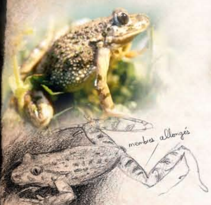
Pélobodyte ponctuée 5 cm

♂♀ Muséum arrondi et busqué Masque sombre Tympan plus petit que l'œil (1/2 taille de l'œil) Pupille horizontale