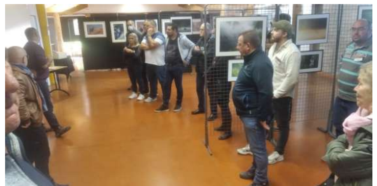
Exposition « Objectif Nature Auvergne » 11ème édition