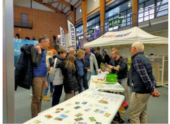
Team des ambassadeurs biodiversité au Trail de Vulcain