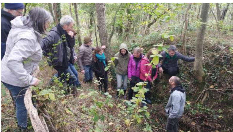
Chantier « Ambassadeur pour la biodiversité »