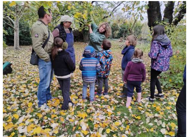
Animations nature proposées par nos ambassadeurs