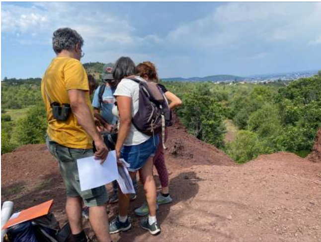
Journée de formation « Ambassadeur pour la biodiversité »