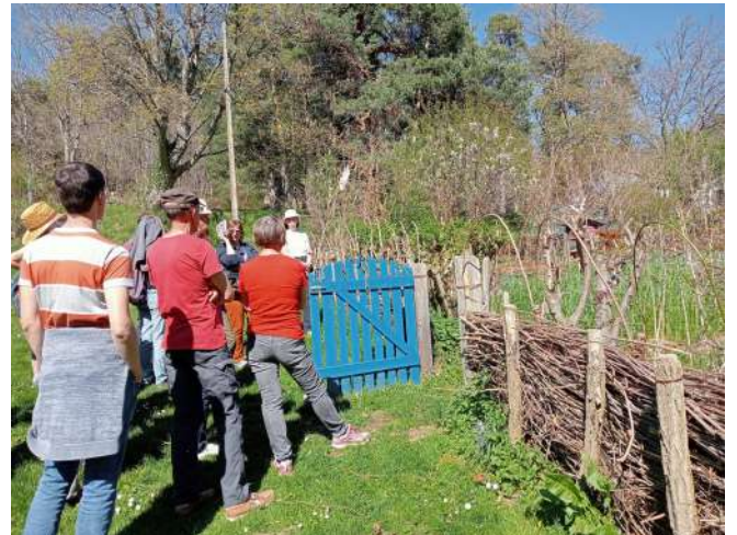
Journée de formation « Ambassadeur du Jardin »