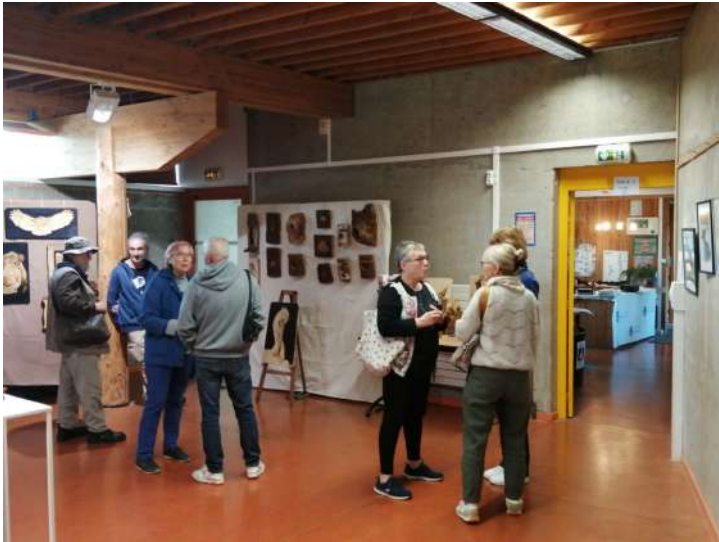
Evènement Art et Nature « La nature au bout des doigts »