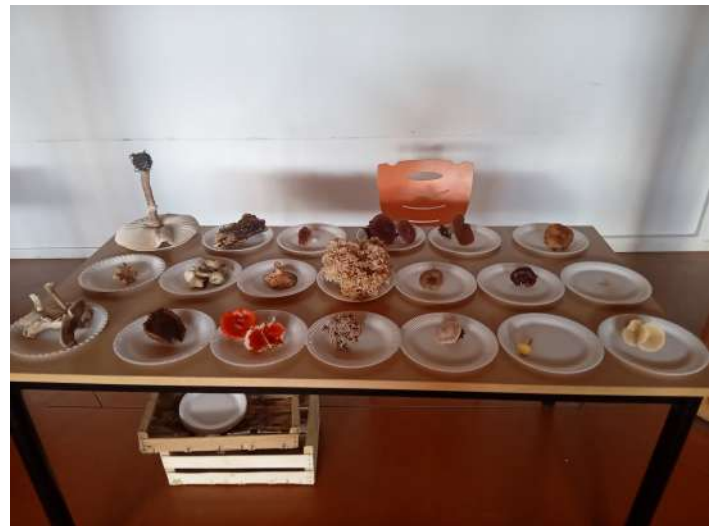
Conférence « Les principaux champignons comestibles et leurs faux-semblants » par le Groupe Mycologique de Cournon d'Auvergne