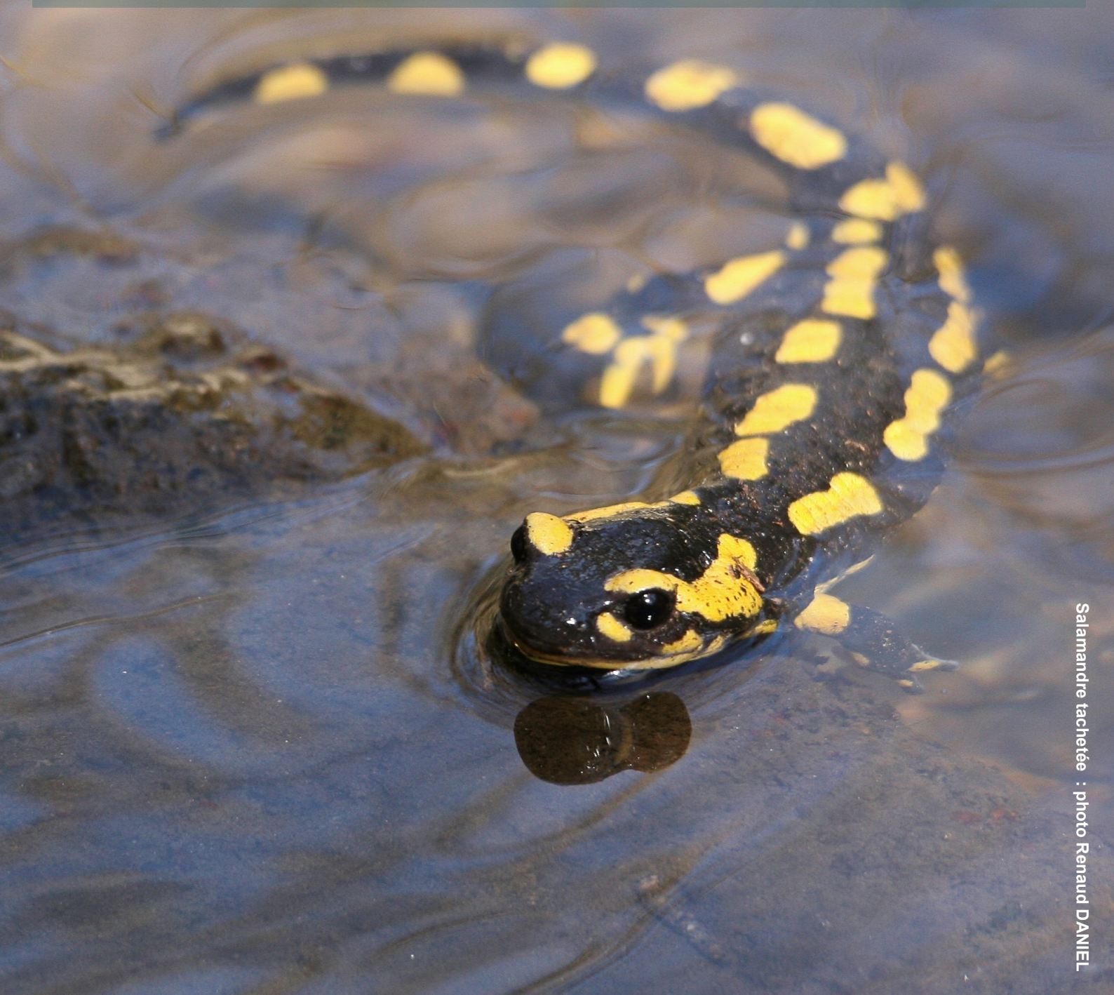
Salamandre tachetée : photo Renaud DANIEL