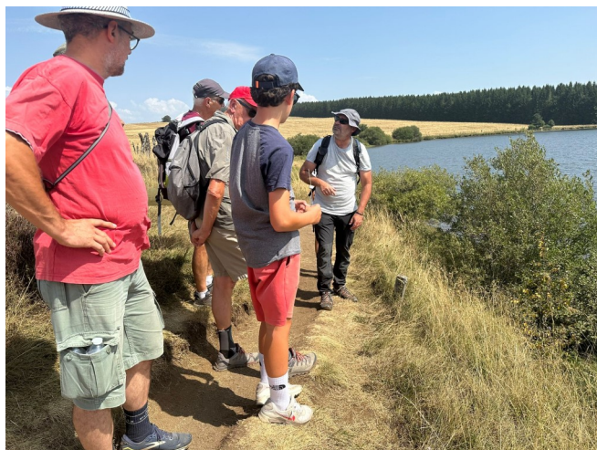
Sortie nature au lac de Bourdouze - 13 août