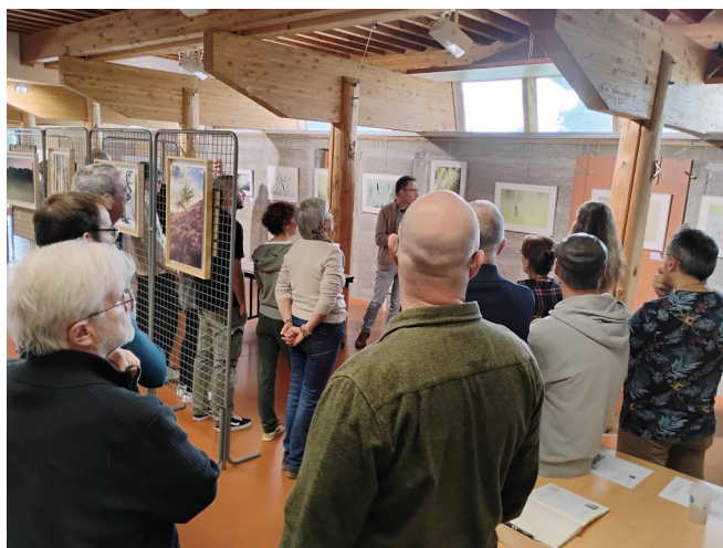
Exposition « Objectif Nature Auvergne » 12ème édition - 04 et 05 octobre