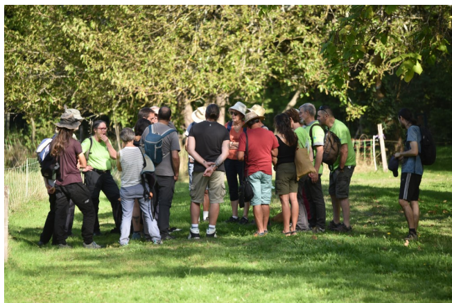
Le Grand Défi Biodiversité 4ème édition au château d'Aulteribe - 20 septembre