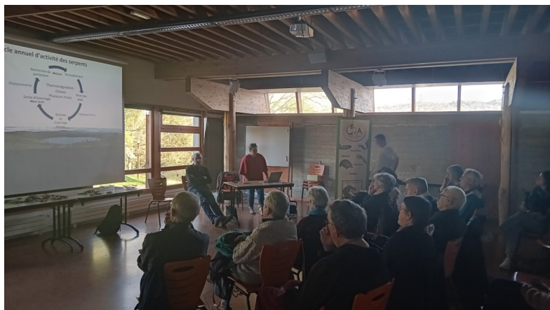
Présentation du dispositif SOS Serpents par l'Observatoire des Reptiles d'Auvergne (ORA) - 18 avril